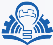
فراصوت تجهیز ایرانیان (ایران التراسونیک) شرکت دانش بنیان

شرکت فراصوت تجهیز ایرانیان (ایران التراسونیک)، توسط جمعی از نخبگان دانشگاهی و صنعتی تشکیل گردیده است. این شرکت در زمینه طراحی و ساخت مجموعه‌های التراسونیک توان بالا، طراحی و ساخت ماشین‌آلات مورد نیاز صنایع، خدمات مترولوژیکی، مشاوره پروژه‌های صنعتی و دانشگاهی، کمک به تجاری‌سازی دستاوردهای پژوهشگران و خدمات مهندسی معکوس فعالیت می‌کند.