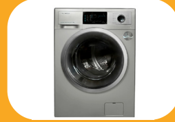
تولید دسته سیم لوازم خانگی