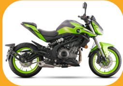
تولید دسته سیم موتورسیکلت