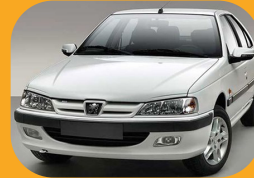
تولید دسته سیم خودرو