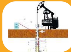
بازیابی چاه‌های نفتی