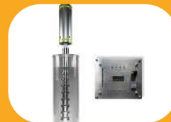
هموژنایز کردن لبنیات عصاره گیری گیاهان دارویی