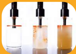
همگن سازی نانوذرات