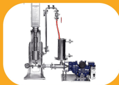
انحلال ذرات رنگ در محلول‌ها